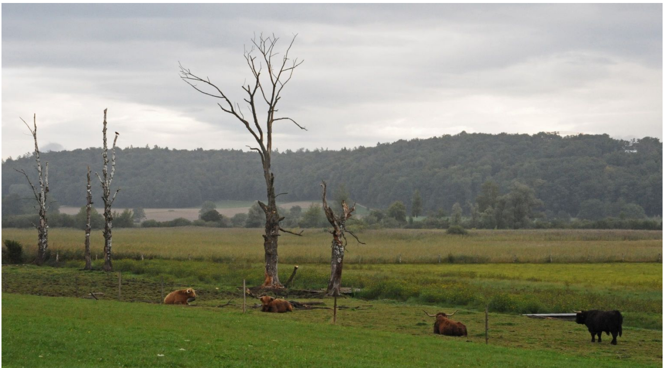
Schottische Hochlandrinder werden für den Unterhalt des Rieds eingesetzt