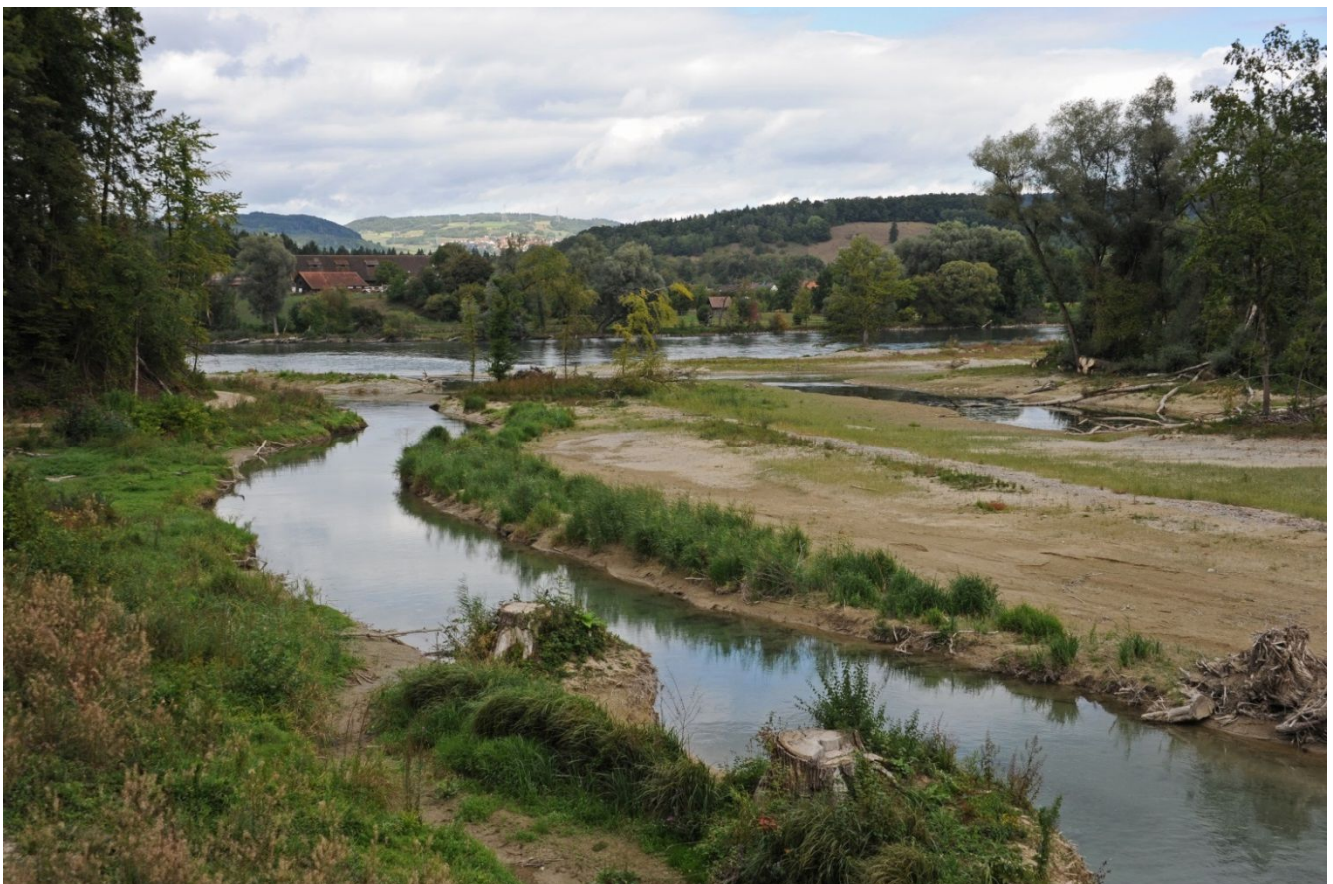
Blick von der Bunkerplattform Richtung Rhein