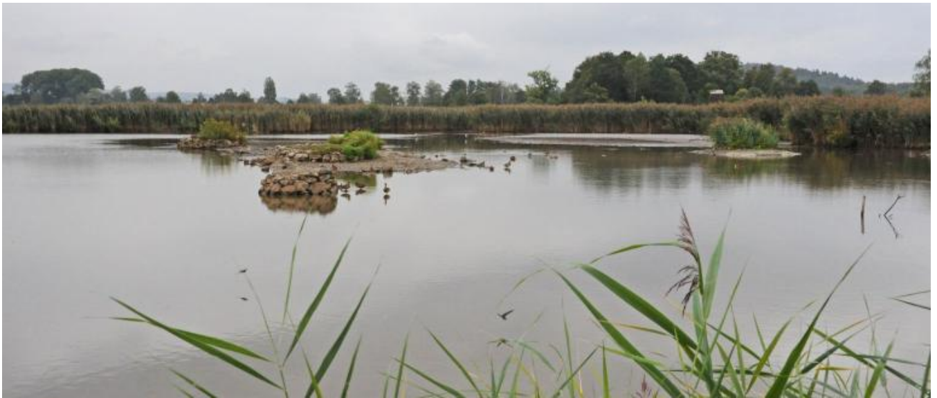
Von den Hides aus konnten überraschend viele verschieden Wasservögel beobachtet werden