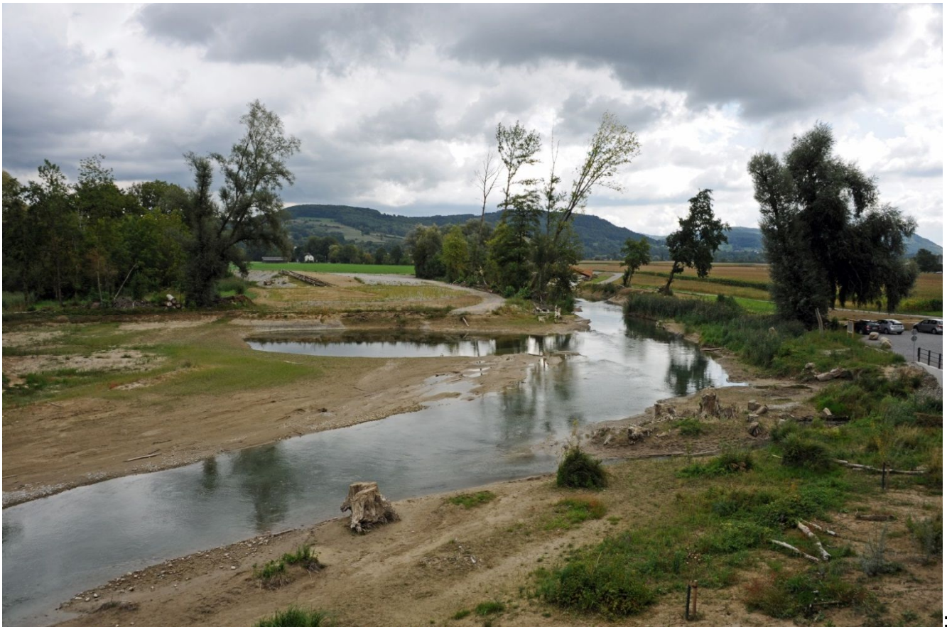
Blick von der Bunkerplattform Richtung kleiner Rhein