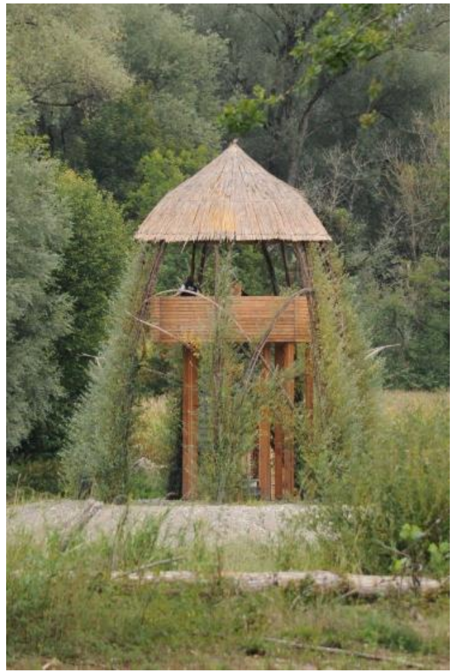
Aussichtsplattform in einem Turm aus Weidenholz