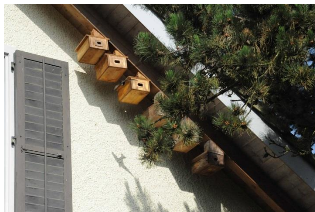
Mauerseglerkästen mit abfliegendem Segler an Privathaus