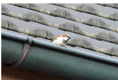
Aufmerksame Beobachter: Haussperlinge, der Vogel des Jahres 2015