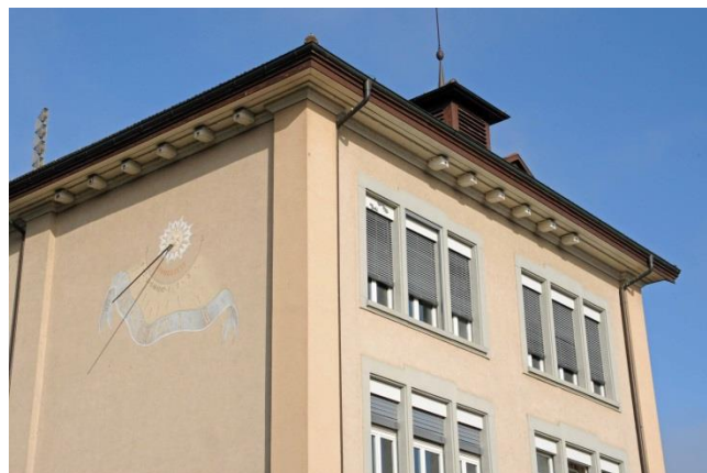
Mauerseglerkästen am ehemaligen Gemeindehaus